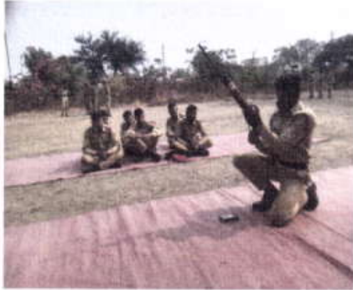
Weapon training organised at college