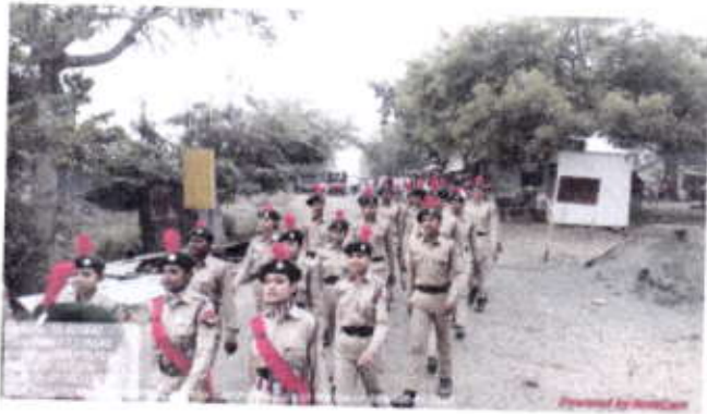
Kargil Vijay Divas Celebrated in College