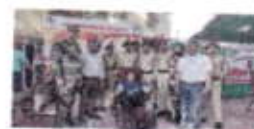
camp organised at college