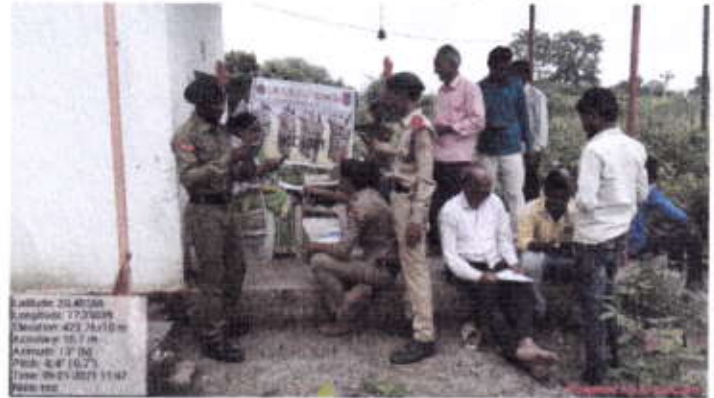
Cadet inform to farmer about E-Pik form