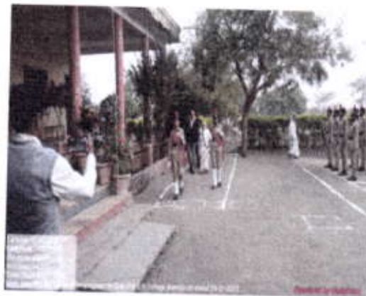
Pilot Drill on Independent day Celebrated in Our College